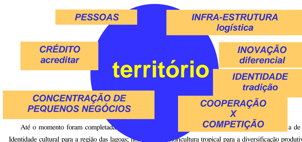
Figura 1-Territórios Produtivos: Forças Transformadoras

Até o momento foram completadas as seguintes ações: a) a criação de uma identidade cultural para a região das lagoas; b) a implementação da agricultura tropical para a diversificação produtiva na Zona da Mata Norte; a região do inhame no Vale do Rio Paraíba; a agroecologia no Agreste; a fruticultura no Agreste; a ovinocaprinocultura no Sertão; os laticínios na bacia leiteira do Sertão; a apicultura do Sertão de São Francisco; os artefatos de couro em Batalha; a apicultura na Mata e Sertão; a laranja lima no Agreste; entre outros.